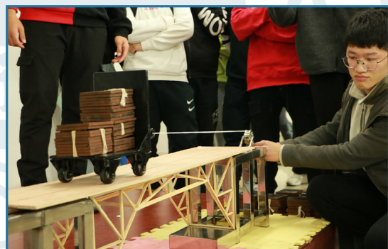
桥梁结构设计大赛